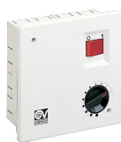
SCNRB SCAT.COM.NON REV.INCASSO Kód 12971