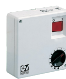
C 1,5 (COMANDO EL. 1,5 A) Kód 12966