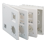
SÚPRAVA SCB (TRASF.EC) Kód 22481